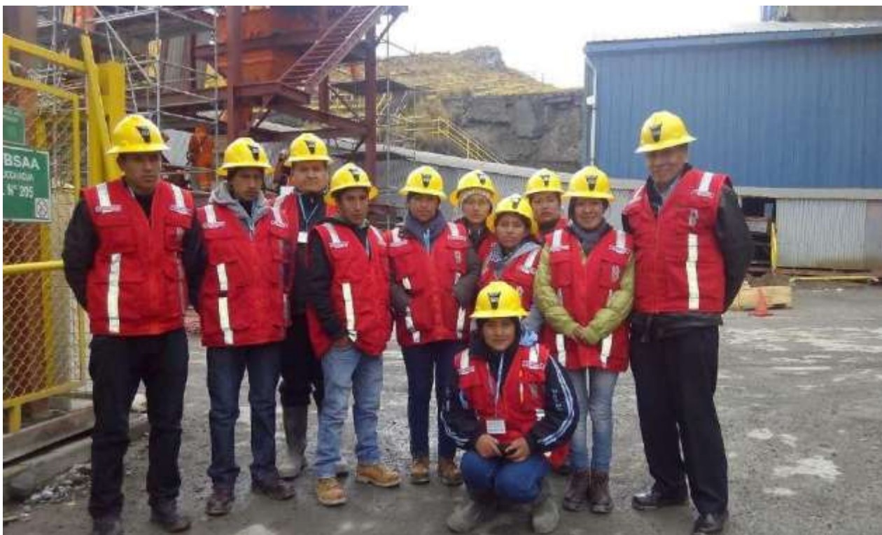
Estudiantes y docentes de visita técnica a la Planta Concentradora de Cia. Minera Uchucchacua

Actividad profesional destinada a la realización de tareas y operaciones de carácter tecnológico en las áreas de metalurgia extractiva en su etapa de Concentración de los Minerales poniendo en práctica los procedimientos de preparación mecánica de minerales y aplicando los métodos de análisis químico de minerales y concentración de minerales adecuados, así como los métodos hidrometalúrgicos de recuperación metálica.