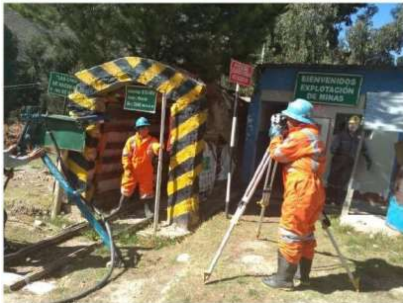
Estudiantes realizando practicas Topografía Superficial