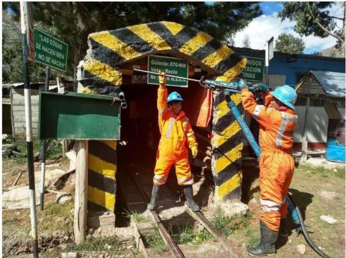
Estudiantes realizando prácticas de perforación de rocas en la galería minera